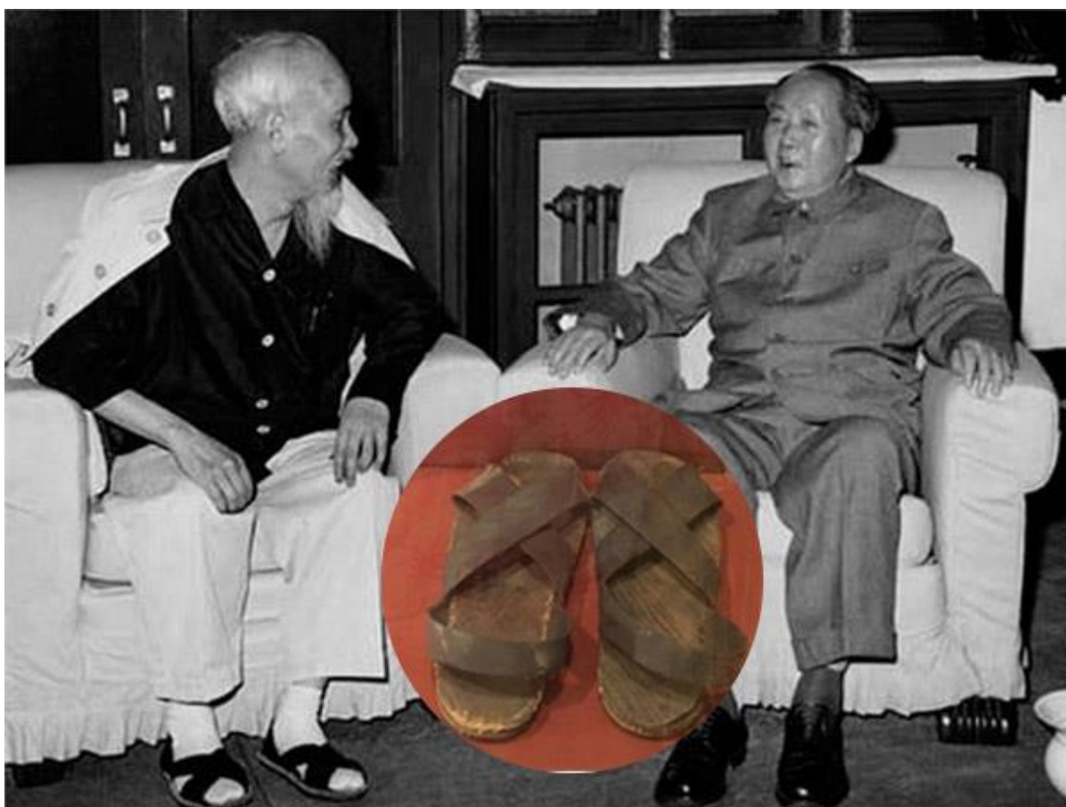
Kể chuyện Bác Hồ - Tổng hợp 20 mẫu chuyện hay và ý nghĩa nhất về Bác

Mười một năm rồi vẫn đôi dép ấy... Các chiến sĩ cảnh vệ cũng đã đôi ba lần “xin” Bác đổi dép nhưng Bác bảo “vẫn còn đi được”.